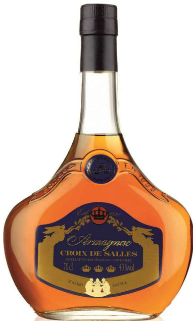
Dartigalongue Croix de Salles

Para la elaboración del Croix de Salles sólo se utilizan los vinos blancos procedentes de cepas determinadas por la reglamentación, vinificados por el sistema tradicional y sin trasiegos.